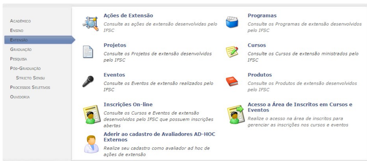
Portal público do SIGAA-Extensão

Endereço para inscrições online: https://sigaa.ifsc.edu.br/sigaa/public/home.jsf#