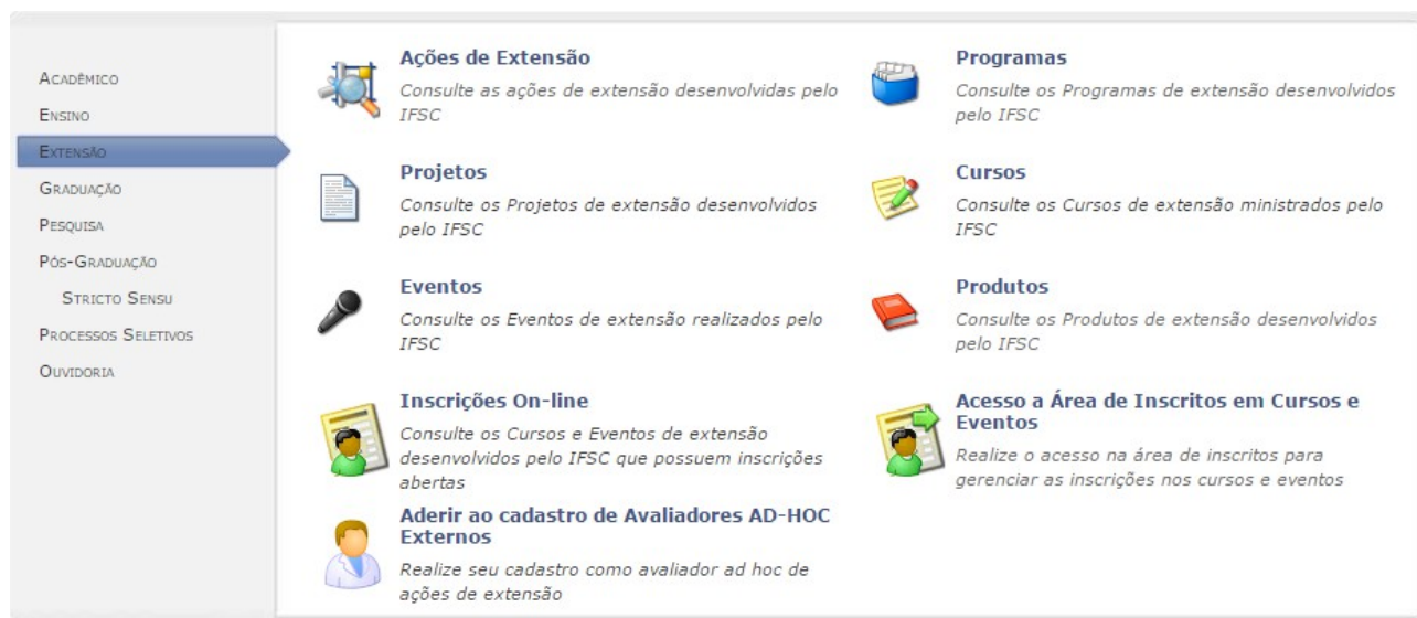
Portal público do SIGAA-Extensão

Após realizar submissão de inscrição, o(a) interessado(a) receberá orientações no e-mail. Será necessário validar a inscrição clicando no link do e-mail e informando a senha de confirmação. A Proex não se responsabiliza por requerimentos de inscrições não recebidos em decorrência de eventuais problemas técnicos.