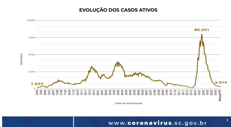
Figura 2 - Evolução dos casos ativos em SC

Considerando dados gerais do estado de Santa Catarina, verifica-se queda no número de casos ativos, desde o pico de incidência ocorrido em janeiro de 2022 devido à chegada ao estado da variante Ômicron. A partir do mês de março de 2022, o número de casos ativos, que já havia se reduzido drasticamente, continuou em queda.