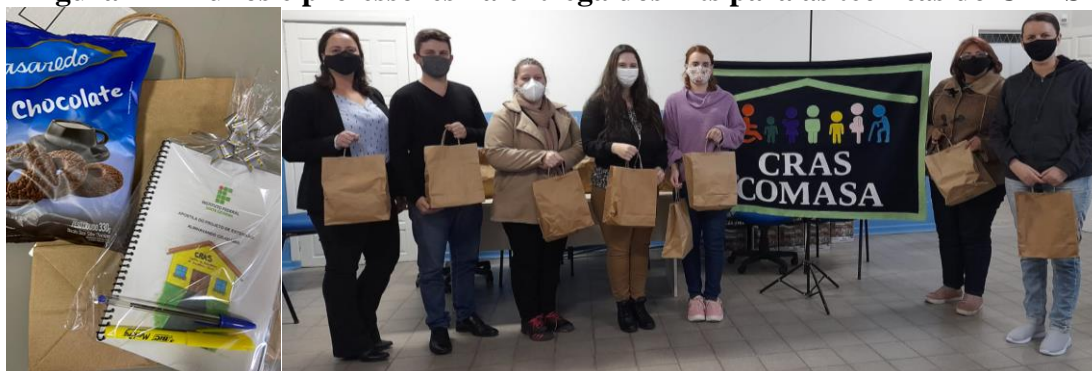
Figura 2 – Alunos e professores na entrega dos kits para as técnicas do CRAS

orientações para visualização dos vídeos. As produções audiovisuais foram encaminhadas uma de cada vez, semanalmente, pelos técnicos do CRAS aos participantes do projeto.