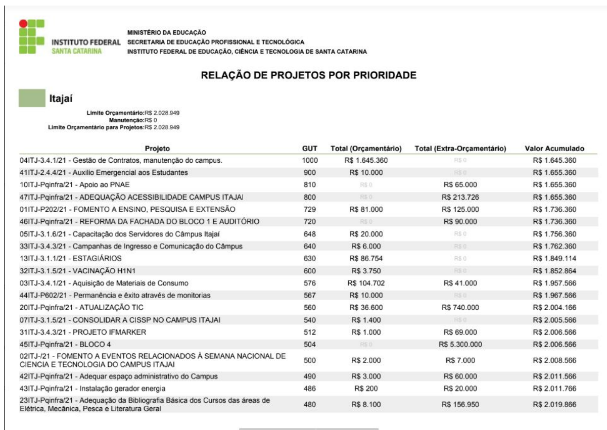
Figura 1 - Proposta com os Projetos aprovados PAT 2021 em julho