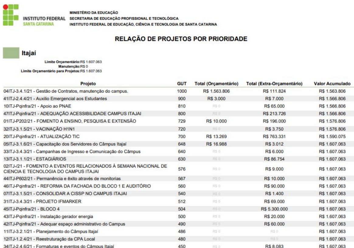
Figura 2 - Proposta PAT 2021, com valores reajustados ao novo limite orçamentário.