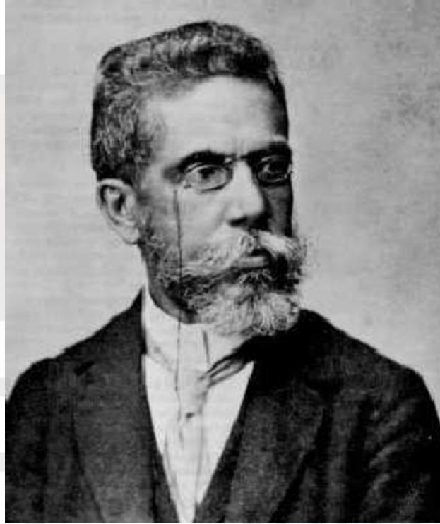
Figura 1 – Machado de Assis