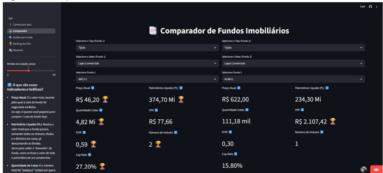
Figura 2 – Comparador de FII's lado a lado com filtros dinâmicos.