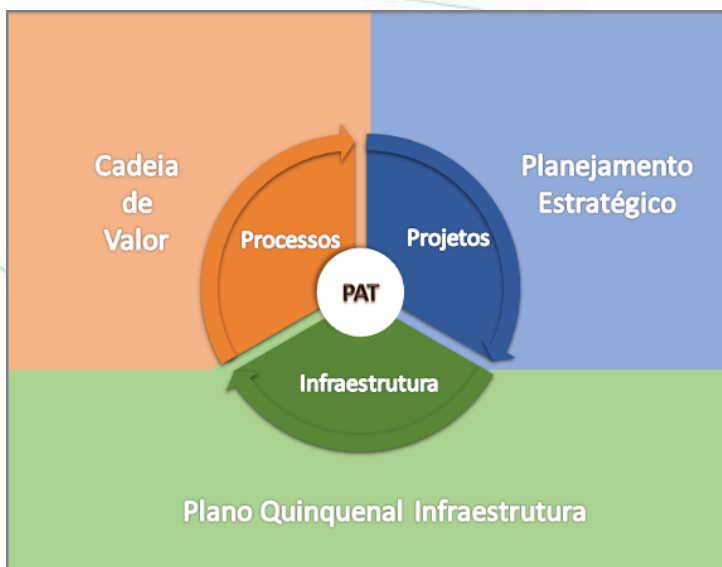
Figura 10.2 Componentes do Plano Anual de Trabalho

Assim, o planejamento institucional atinge sua dimensão operacional, orientando a agenda de trabalho dos câmpus e reitoria na execução das diretrizes estratégicas. A participação dos servidores no processo de elaboração do PAT reforça a gestão participativa projetada na Visão de futuro do IFSC, e remete a todos os envolvidos a responsabilidade pela condução da Instituição.