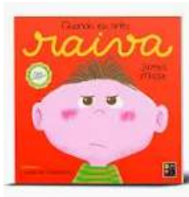
Imagem 1: Capa do livro da história

3º passo - Momento da troca de ideias que eles tiveram durante a história, qual parte eles já viveram, o que eles fizeram, qual parte achou mais legal. Lembrando que fala quem estiver com o objeto da fala.