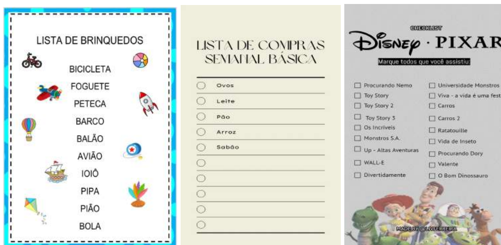
Imagem 2: Exemplo de listas

Nesta atividade vamos separar as crianças em dois grandes grupos, e elas terão que achar o gênero lista diante de vários gêneros textuais (bilhete, receita, carta, poema). Para assim colar, na cartolina que foi disponibilizada para cada grupo, em duas colunas diferentes: gênero lista // outros gêneros.